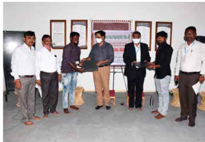
ಸಬರಮತಿ ಆಶ್ರಮದಲ್ಲಿ ಗಾಂಧಿ ಸತ್ಯಂಗ ಹಾಗೂ ಪರಿಶಿಷ್ಟ ಜಾತಿ ಹಾಗೂ ಪರಿಶಿಷ್ಟ ಪಂಗಡದ ವಿದ್ಯಾರ್ಥಿಗಳಿಗೆ ಉಚಿತ ಲ್ಯಾಪ್ ಟಾಪ್ ವಿತರಣೆ

2020ರ ನವೆಂಬರ್ ತಿಂಗಳಿನಿಂದ ಪ್ರತೀ ತಿಂಗಳ 11 ನೇ ದಿನಾಂಕದಂದು ವಿಶ್ವವಿದ್ಯಾಲಯದ ನೂತನ ಕ್ಯಾಂಪಸ್‌ನಲ್ಲಿ ನಿರ್ಮಿಸಲಾದ ಗಾಂಧೀಜಿಯವ ಸಬರಮತಿ ಆಶ್ರಮದ ಪ್ರತಿಕೃತಿಯ ಕಟ್ಟಡದ ಆವರಣದಲ್ಲಿ ಗಾಂಧಿ ಚಿಂತನ - ಮಂಥನ ಹಾಗೂ ಸತ್ಯಂಗ ಕಾರ್ಯಕ್ರಮವನ್ನು ಹಮ್ಮಿಕೊಳ್ಳಲಾಗುತ್ತಿದ್ದು, ವಿಶ್ವವಿದ್ಯಾಲಯದಲ್ಲಿ ಜರುಗಿದ ನೂತನ ಬ್ಯಾಚ್ ನ ವಿದ್ಯಾರ್ಥಿಗಳಿಗೆ ಸ್ವಾಗತ ಕಾರ್ಯಕ್ರಮದ ಕಾರಣದಿಂದ ಎರಡನೇ ಗಾಂಧಿ ಚಿಂತನ - ಮಂಥನ ಹಾಗೂ ಸತ್ಯಂಗ ಕಾರ್ಯಕ್ರಮವನ್ನು ದಿನಾಂಕ 14 ಡಿಸೆಂಬರ್ 2020 ರಂದು ವಿಶ್ವವಿದ್ಯಾಲಯದ ಪರಿಶಿಷ್ಟ