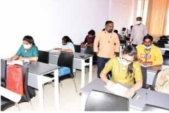
ಮತದಾನ ಜಾಗೃತಿ ಅಭಿಯಾನ

ಜಾತಿ ಮತ್ತು ಪರಿಶಿಷ್ಟ ಪಂಗಡದ ವಿದ್ಯಾರ್ಥಿಗಳಿಗೆ ಉಚಿತ ಲ್ಯಾಪ್‌ಟಾಪ್‌ಗಳನ್ನು ವಿತರಿಸುವ ಮೂಲಕ ಅರ್ಥಪೂರ್ಣವಾಗಿ ಹಮ್ಮಿಕೊಳ್ಳಲಾಯಿತು.