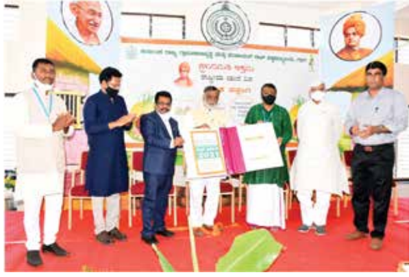
ಅತಿಥಿಗಳು ಪುಸ್ತಕ ಪ್ರದರ್ಶನಕ್ಕೆ ಚಾಲನೆ ನೀಡುತ್ತಿರುವುದು.